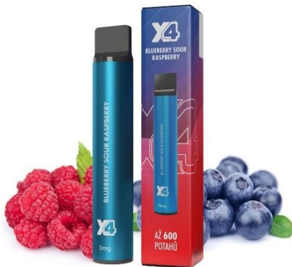
VEJP Z OKUSOM MALINA IN BOROVNICA

"Elektronska cigareta je izdelek, v katerem baterija segreva posebno tekočino, da se spremeni v aerosol, ki ga nato uporabnik vdihuje," piše v publikaciji NIJZ-ja, kjer je nadalje pojasnjeno, da je aerosol, ki ga med kajenjem elektronske cigarete nastaja veliko, viden kot fina meglica.