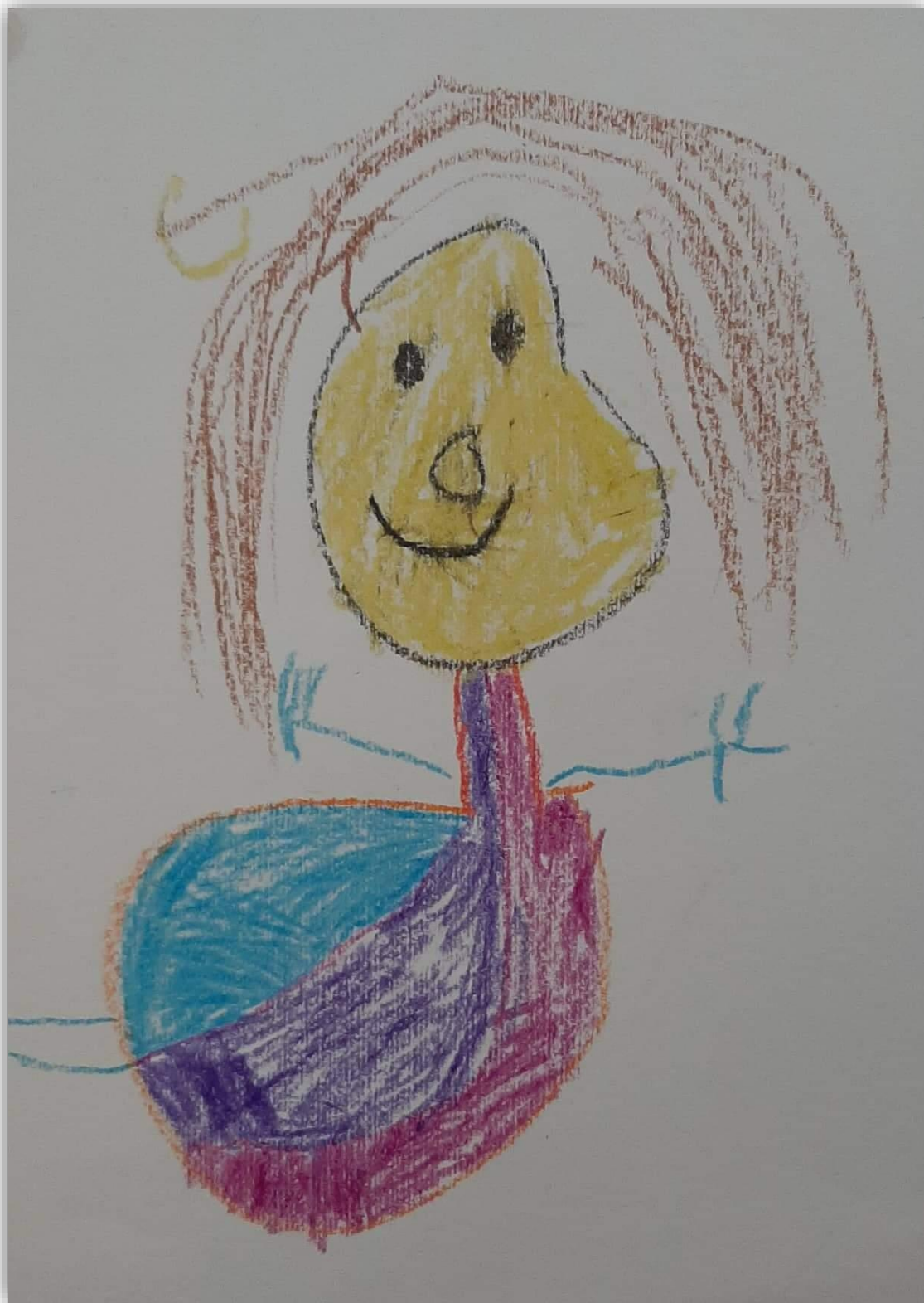
Likovni prispevki: otroci Vrtca Prebold Vsebina: Mateja Matko, pom. ravnatelj za vrtec, Lidija Selič, dipl. vzg. pred. otrok Oblikovanje in urejanje: Lidija Selič, dipl. vzg. pred. otrok